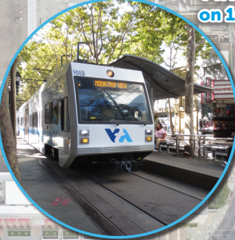
VTA Transit Mall on 1st and 2nd Streets

NOTA: • Se esperan cierres de calles y carriles temporales e intermitentes en el área de construcción y de almacenaje y preparación para construcción. • Este es un documento de planificación sujeto a cambios.