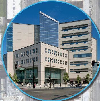
San José State University